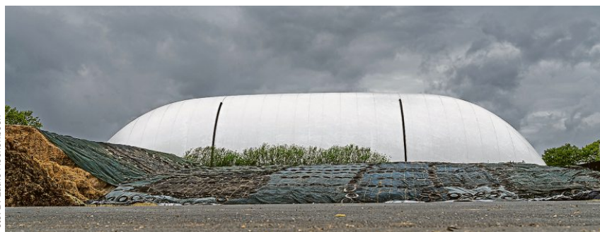
Zwei Energiespeicher auf einem Bild: Im Hintergrund ist der Gasspeicher, das „Tüttendorfer Ei“, zu sehen. Im Vordergrund liegt Silage. Sie speichert Sonnenenergie von der Ernte bis zum Einsatz in der Biogasanlage.